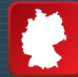
Fertigung in Deutschland